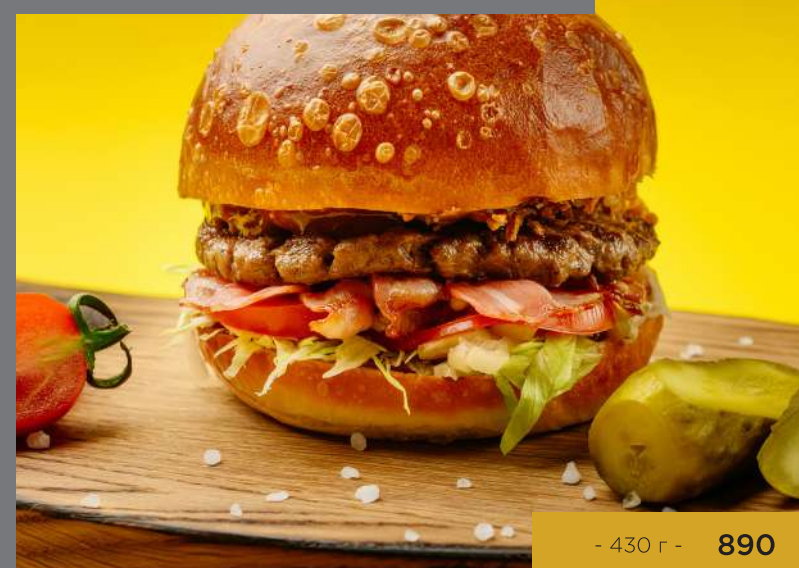
БУРГЕР ВВQ С МРАМОРНОЙ ГОВЯДИНОЙ И БЕКОНОМ