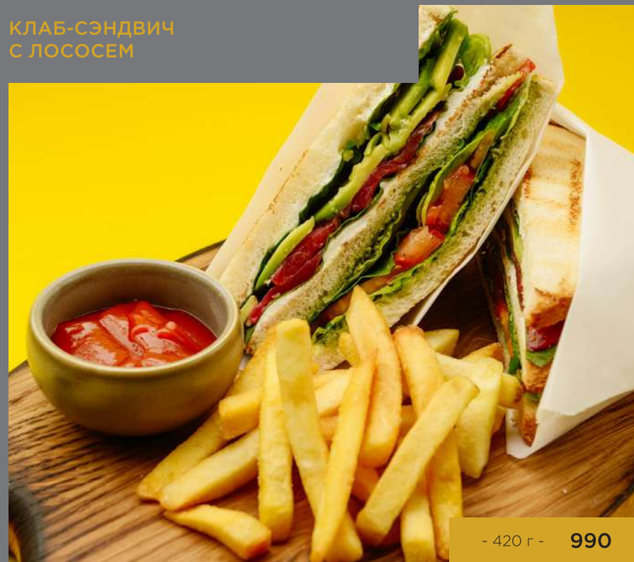
КЛАБ-СЭНДВИЧ С ЛОСОСЕМ