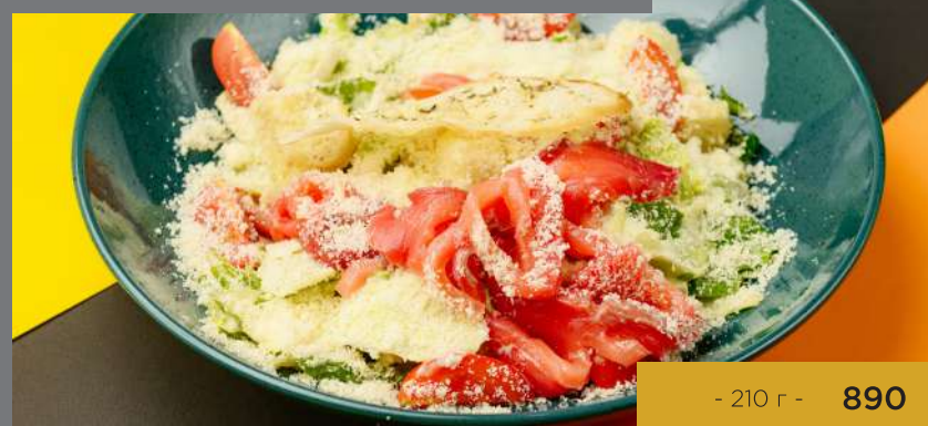
ЦЕЗАРЬ С ЛОСОСЕМ И ПШЕНИЧНЫМИ ЧИПСАМИ